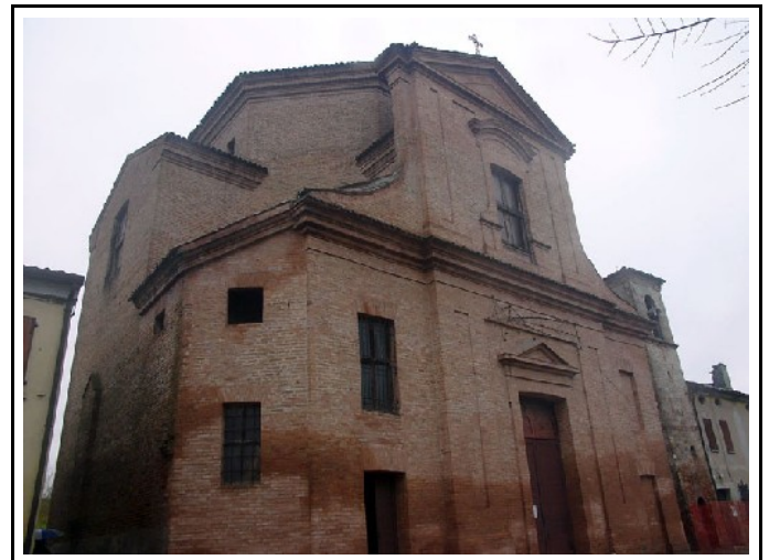
Vista della facciata